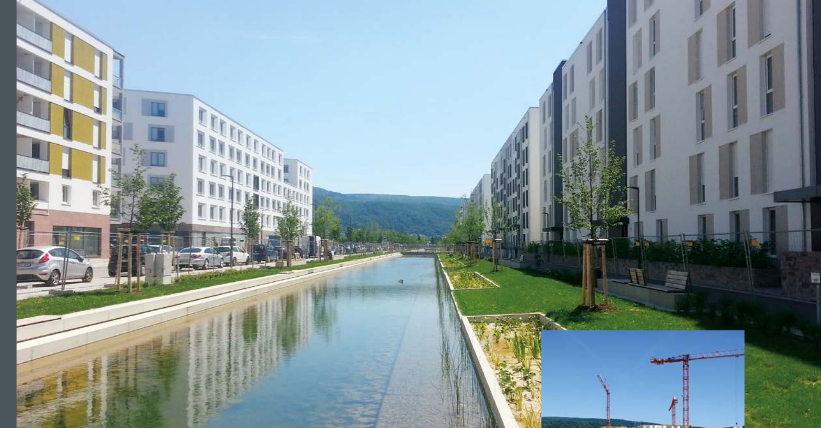
Bahnstadt Heidelberg Langer Anger

gedruckt auf 100% Recycling-Papier Circle Silk