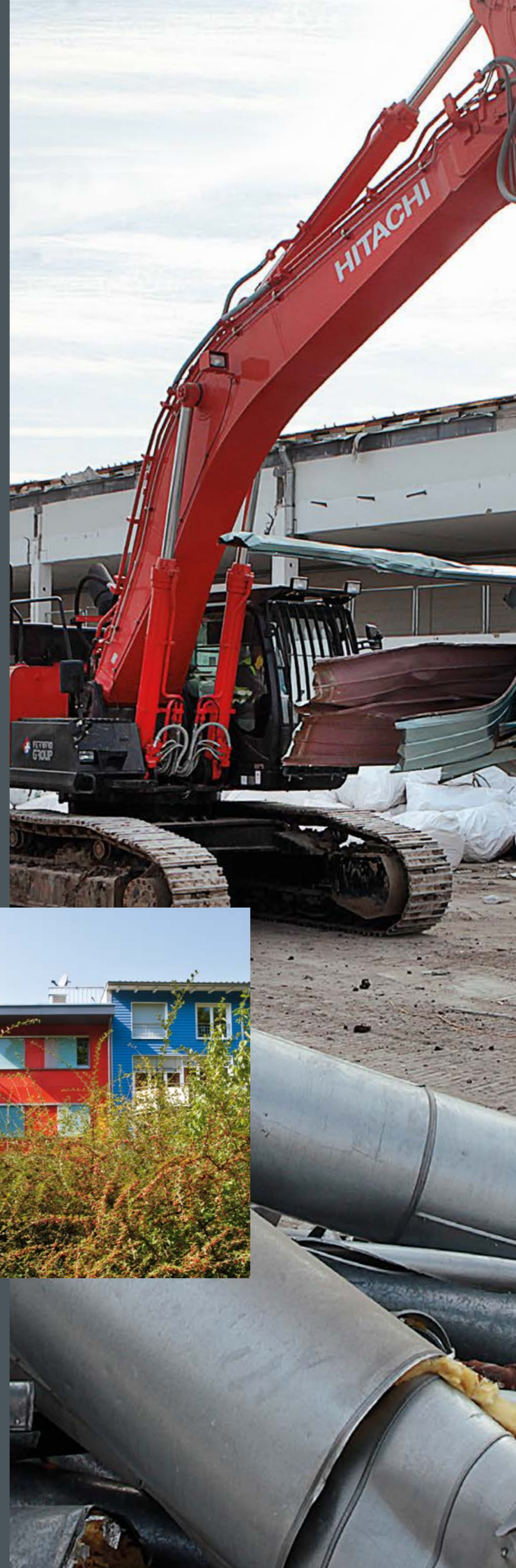
Münsingen Pattonville Heidelberg Würzburg